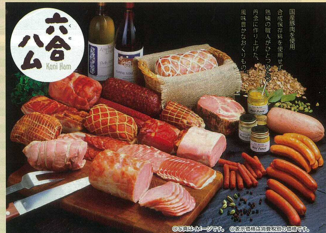
◎写真はイメージです。◎表示価格は消費税別の価格です。

期間限定 12/11迄 期間限定の商品は12月11日までのお取り扱いとなります。冷蔵 冷蔵状態で配送いたします。冷凍 冷凍状態で配送いたします。常温 常温で配送いたします。